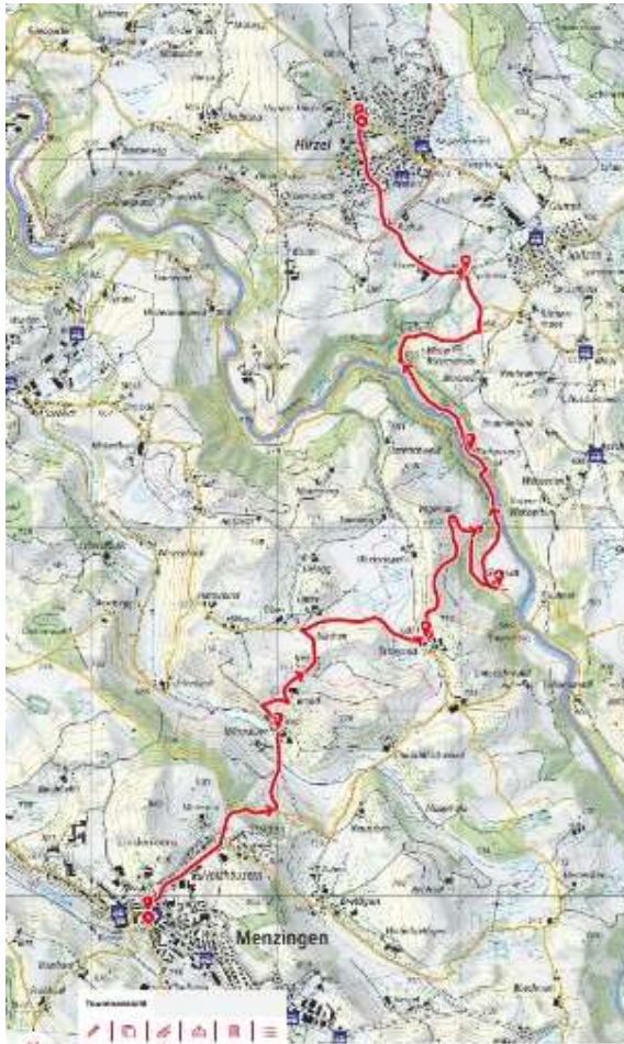
Menzingen - Sihlmatt - Hirzel | 10.4.2026 | Tour