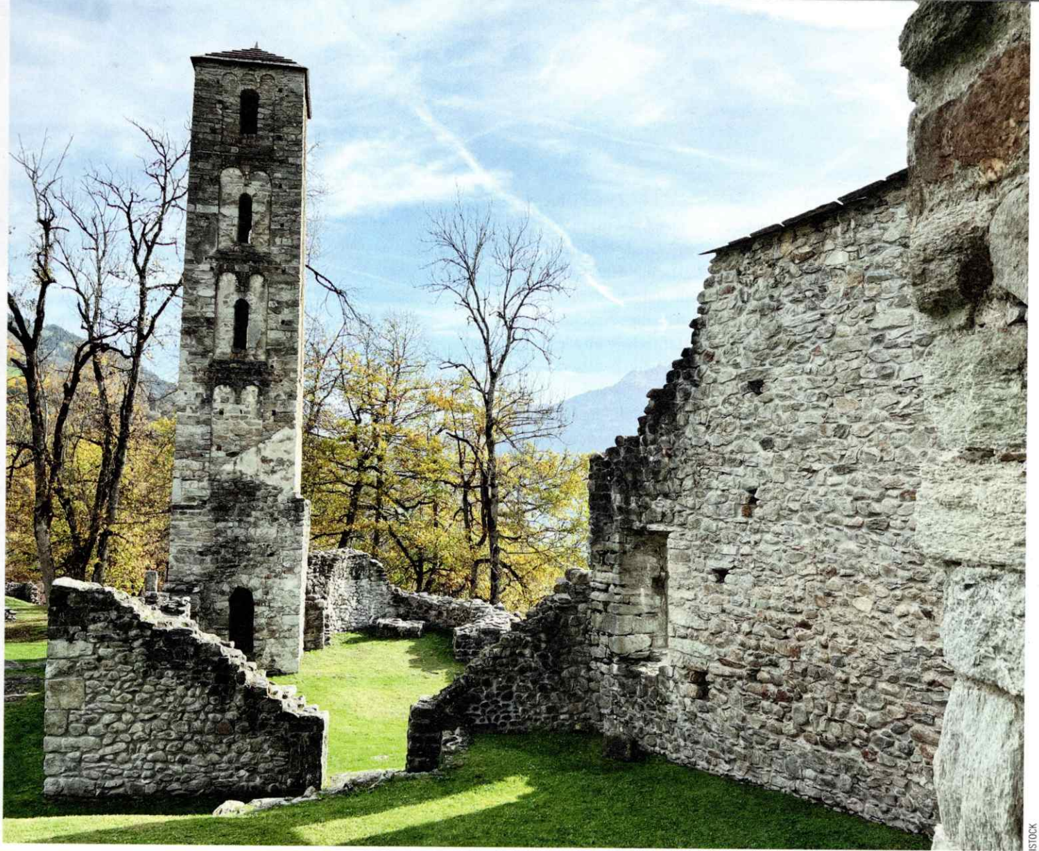
Jörgenberg: Der uralten Schlossanlage begegnet man bei der Wandertour in der Surselva GR