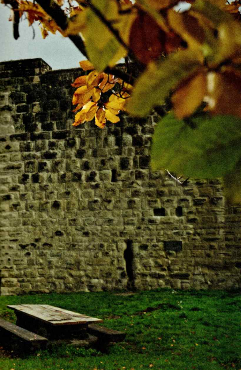
n zu Burgruinen