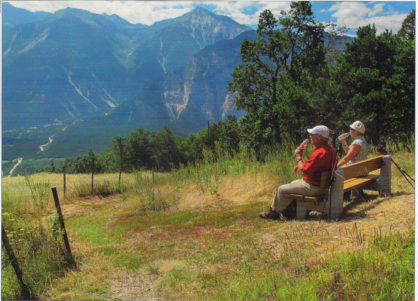
↑ Pause mit Aussicht. Weit unten das Rhonetal.