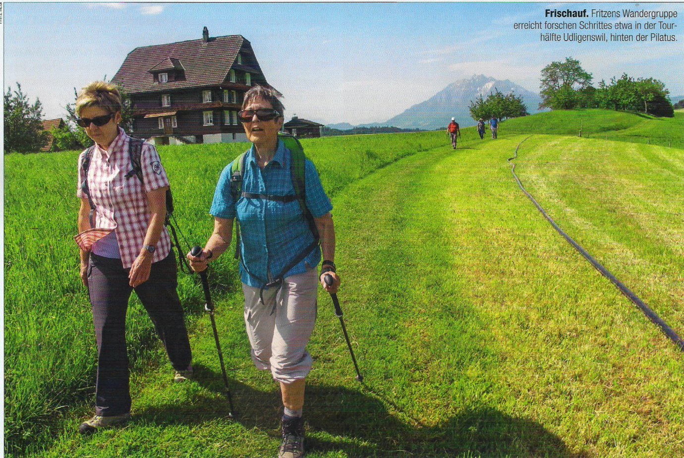
Frischauf. Fritzens Wandergruppe erreicht forschen Schrittes etwa in der Tourhälfte Udligenswil, hinten der Pilatus.

HERAUSTRENNEN UND SAMMELN SCHWEIZ 9/2014