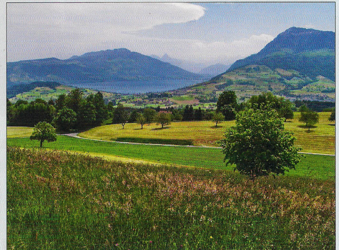
↑ Voralpenlandschaft. Blick vom Michaelskreuz Richtung Zugerssee und Rigi (rechts).