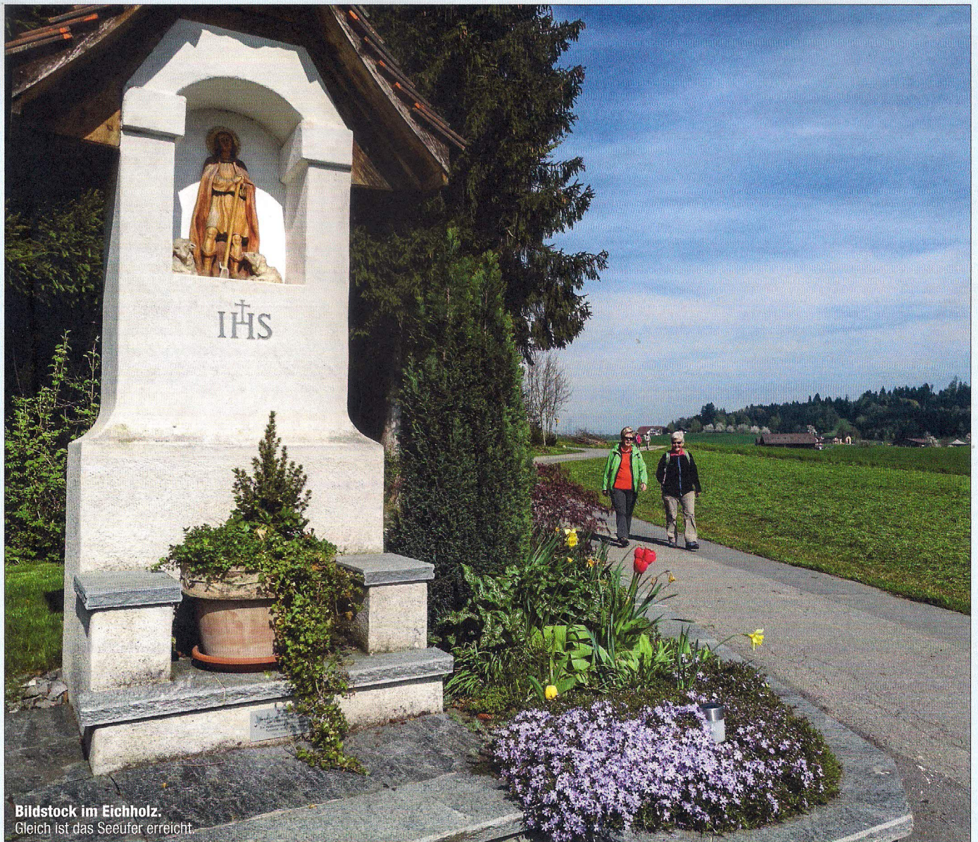
Bildstock im Eichholz. Gleich ist das Seeufer erreicht.